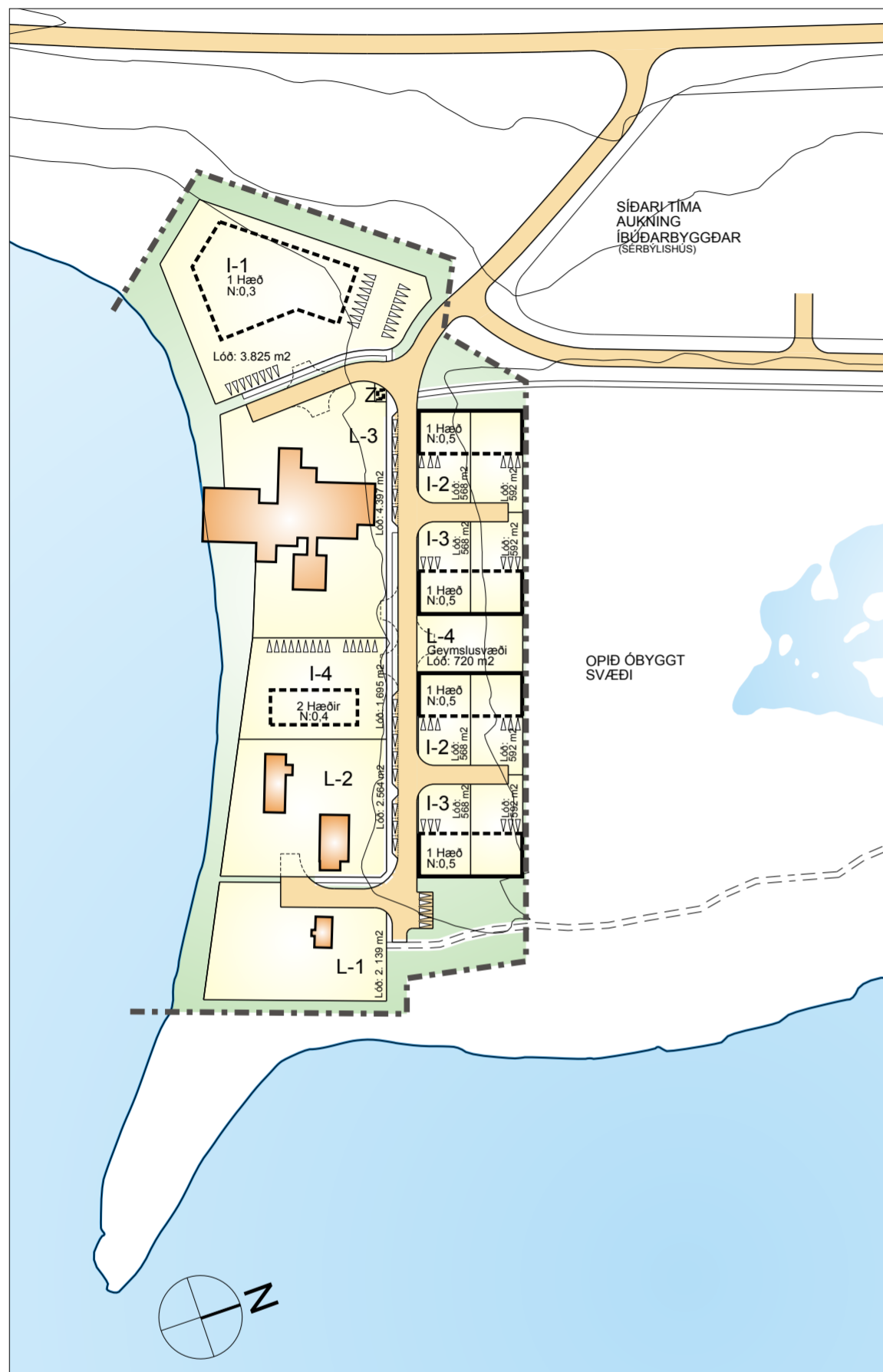
GILDANDI DEILISKIPLAG MKV. 1:2000 SAMÞYKKT Í SVEITARSTJÓRN 27.11.2003